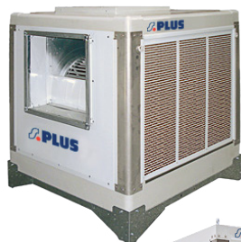
RAE 7 À 15