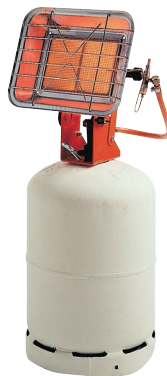
SOLO P 821 SRX/SR