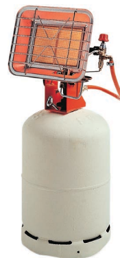
SOLO P 823 CA