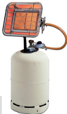
SOLO P 821 T*