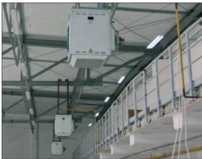
Fixation par suspension uniquement

Les aérothermes à gaz réchauffent l'air du local au contact de leur échangeur; ils chauffent le volume. L'évacuation des fumées est assurée par un extracteur, en cheminée ou par ventouse. L'air est totalement propre.