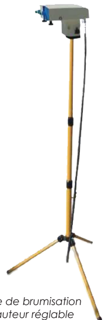
Tête de brumisation hauteur réglable