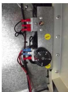
Airstats de sécurité